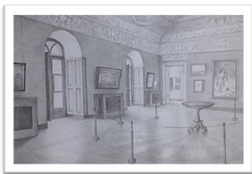
Рис. 3 (а). Задання глибини з урахуванням кутової перспективи. Варіант 1

акварель, аерографіка, колаж, фотомонтаж, може бути використана складна та вишукана техніка рисунку пером у поєднанні з пастельними олівцями. Щодо завдання світлотіні, то способи зображення не відрізняються.