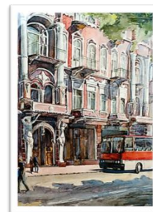
Рис. 7. Мальовничий рисунок

Роль світло-тонованого рисунка, стосовно професії архітектора чи дизайнера, вимагає оперативної динаміки у викладі графічної інформації, раціональних підходів, що пояснюють максимальну достовірність неіснуючого в реальності проєктованого об'єкта, обсягу, форми. Скорочуючи тональний спектр освітленого обсягу можемо розставити чотири групи наростання тону: перша – світло (білий лист), друга – власна тінь вертикальна (один графічний підхід), третя – власна тінь горизонтальна (два графічні підходи), четверта – падаюча тінь (три графічні підходи).