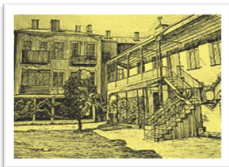
Рис. 2. Зображення єдиного замкнутого простору. Техніка 2