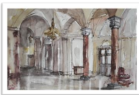
Рис. 3 (б). Задання глибини з урахуванням кутової перспективи. Варіант 2