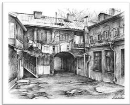
Рис. 1. Зображення єдиного замкнутого простору. Техніка 1

не особливо приємні рамки, чії межі та обтяжене сприйняття можна спростити легшими матеріалами та техніками, як наприклад акварелі по мокрому (рис. 1), (рис. 2, 2(a)).