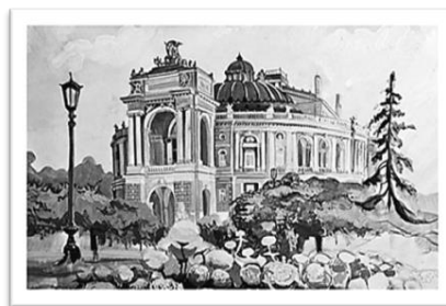
Рис. 6. Світлотіньовий рисунок