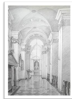
Рис. 4. Задання глибини з урахуванням фронтальної перспективи