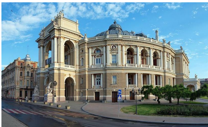
Рис. 1. Одеський театр опери і балету

1 жовтня 2021 р. виповнилося 134 роки з дня відкриття Одеського театру опери і балету (рис. 1), побудованого рівно за три роки за проектом видатних австрійських архітекторів з Відня Фердинанда Фельнера і Германа Гельмера. Проект Одеського театру був однією з вершин їх творчості, а театр – одна з найкрасивіших театральних будівель світу. Присутній на відкритті театру 1 жовтня 1887 року Ф. Фельнер вигукнув: «Це кращий театр в світі!» [2, 3]. Слід зазначити, що підрядчиком був теж австрійський будівельник з Відня Р. Фрей.